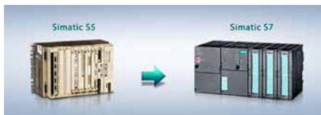
▽ Figuur 3: Migratie van een Siemens S5 plc naar een nieuwe Siemens S7 plc.

Deze Nederlandse versie van de “Gids voor de toepassing van Machinerichtlijn 2006/42/EG” is sinds 25 februari 2011 beschikbaar. Hij is bestemd voor alle partijen die betrokken zijn bij de toepassing van de Machinerichtlijn, zoals fabrikanten, importeurs en distributeurs van machines en functionarissen van aangemelde instanties en markttoezichthouders. Er wordt met nadruk op gewezen dat alleen de Machinerichtlijn en de teksten ter omzetting ervan in nationaal recht, juridisch bindend zijn. De gids is kosteloos en kan in het Nederlands en 20 andere talen gedownload worden, via de volgende weblink: http://ec.europa.eu/DocsRoom/documents/9483/attachments/1/translations