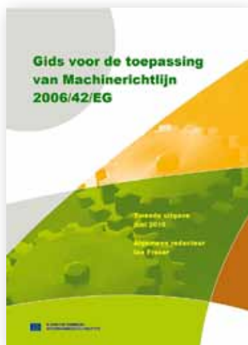
◀ Figuur 1: Nederlandstalige gids voor de toepassing van Machinerichtlijn 2006/42/EG.

Bedrijf X wil nu de verouderde Philips plc-besturing type P8 en de visualisatie pc-besturing, vervangen door een nieuwe Siemens plc-besturing type S7 en een industriële pc met touchscreen (zie figuur 2). Hierbij blijven de bestaande